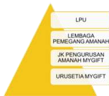
Struktur Governan Pengurusan My Gift

7.1 Lembaga Pengurusan Amanah dan JK Pengurusan Amanah akan menentukan terma rujukan berdasarkan skop dan fungsi yang diluluskan oleh universiti.